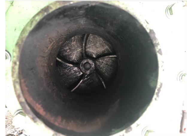
排気管送風ファン