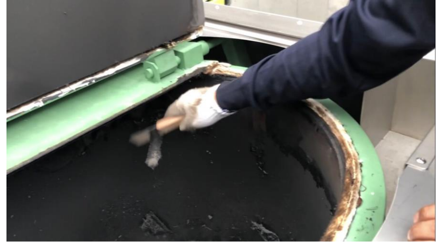
処理物投入釜内部