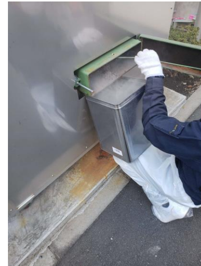
セラミック灰排出口